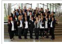
Tempus-Team freut sich über Auszeichnung von GpTW

Jetzt ist es amtlich: Tempus gewinnt in Baden-Württemberg den Wettbewerb „Great Place to Work“ in der Kategorie bis 49 Mitarbeiter. Das Besondere: Bei diesem Wettbewerb beurteilen die Mitarbeiter ihren Arbeitsplatz und ihren Arbeitgeber.