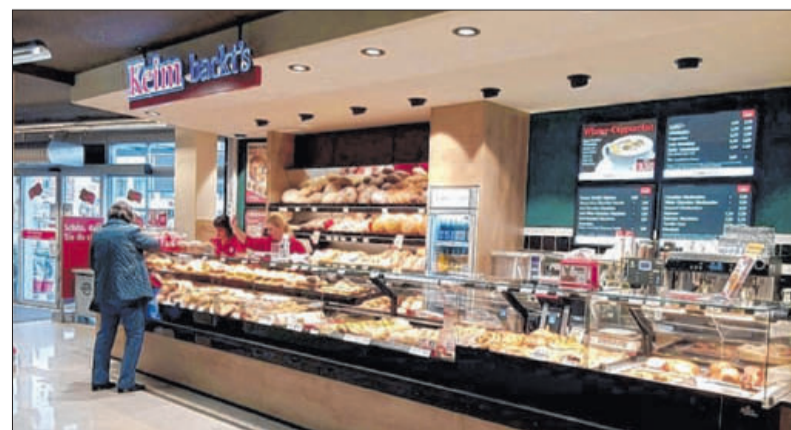
Hell erleuchtet Dank LED-Technik: Fachgeschäft der Bäckerei Keim.