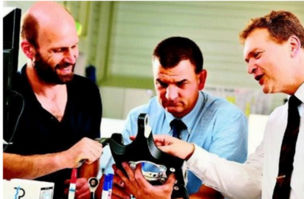
Mit engagierten und kreativen Mitarbeitern entwickelt die UFT Radebeul neue Produkte.