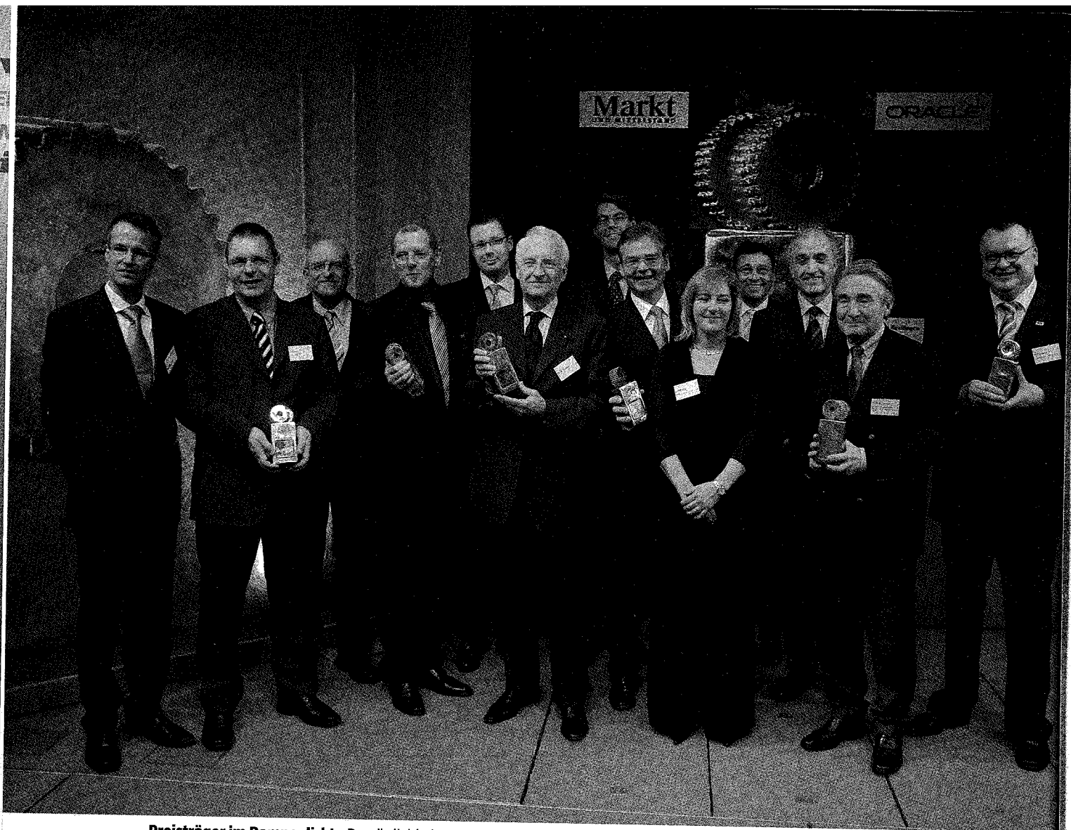
Preisträger im Rampenlicht: Persönlichkeiten aus Politik und Wirtschaft freuen sich über ihre MuM-Awards.